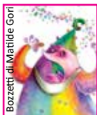
Bozzetti di Matilde Gori

Via del Poggiamè - 11, 12, 13, 14, 15 agosto - dalle ore 20.30