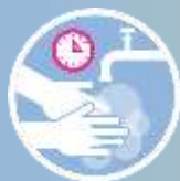
خپل لاسونه وینځئ