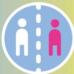
خپل ترمینځ امنیت فاصله وساتئ