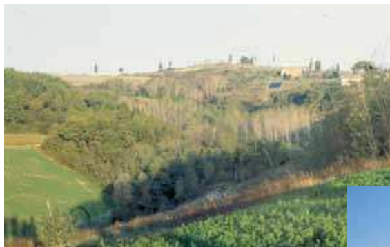
Zona delle colline Sanminiatesi (tartufo bianco)