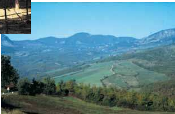
Zona del Mugello (tartufo bianco)