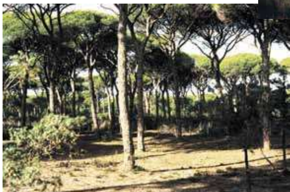
Litorale della Maremma Grossetana (tartufo bianchetto)