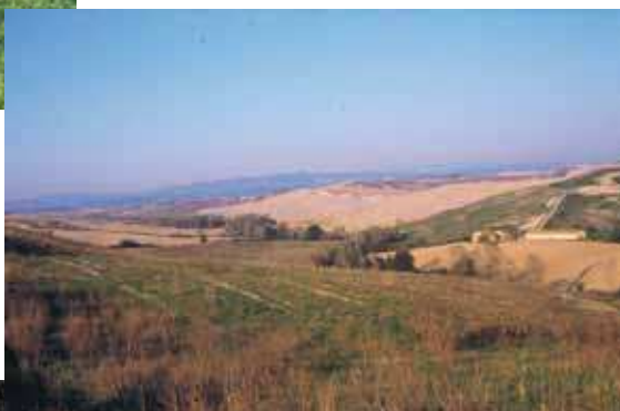
Crete Senesi (tartufo bianco)