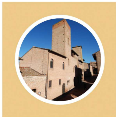
CASA DEL BOCCACCIO