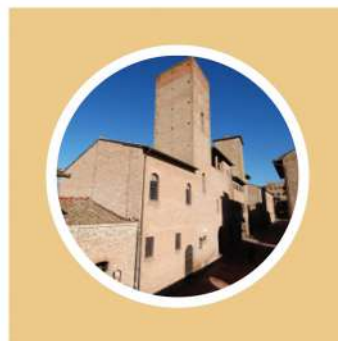
CASA DEL BOCCACCIO