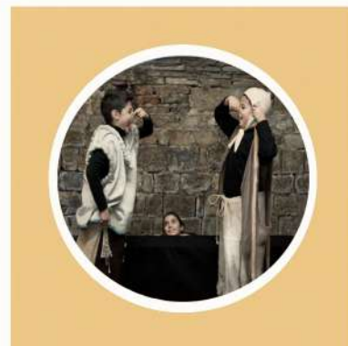
CASA DEL BOCCACCIO