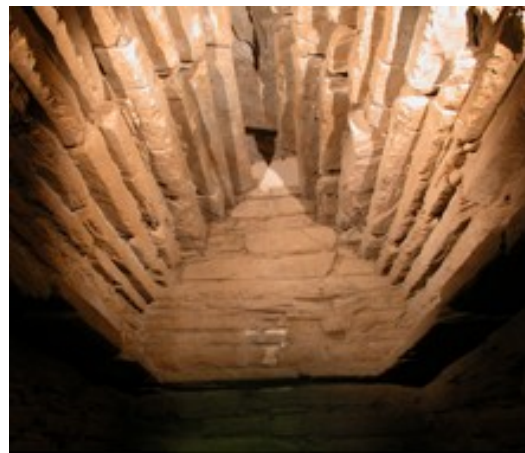
Soffitto della tomba a camera rettangolare del tumulo di Montefortini (fine VII sec. a.C)

Il personale effettuerà visite guidate alle due tombe del tumulo etrusco.