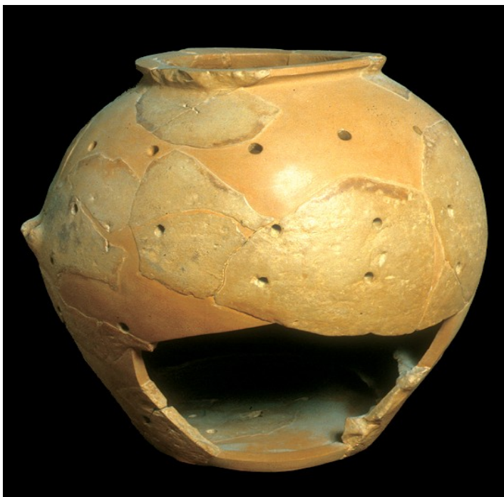
Vaso per allevamento di ghiri.

Il Museo rimarrà aperto dalle ore 20,00 alle ore 24,00. Durante l'apertura straordinaria l'ingresso avverrà al prezzo simbolico di 1 euro.