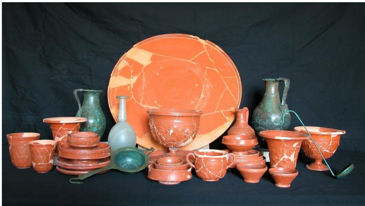
Servito da mensa in terra sigillata aretina, vetro e bronzo (I a.C.- I d.C.)

Ore 19.30 -23.30: Apertura straordinaria del Museo Archeologico, con visite accompagnate a cura del personale.