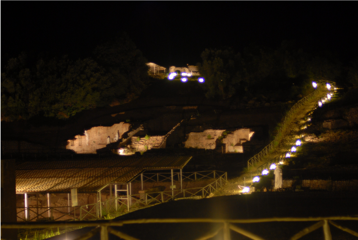
Roselle- l'area archeologica in notturna

Area Archeologica di Roselle Loc. Roselle (GR) Tel. 0564 402403 Ore 19,00 – 23,00 www.archeotoscana.beniculturali.it Ingresso €1