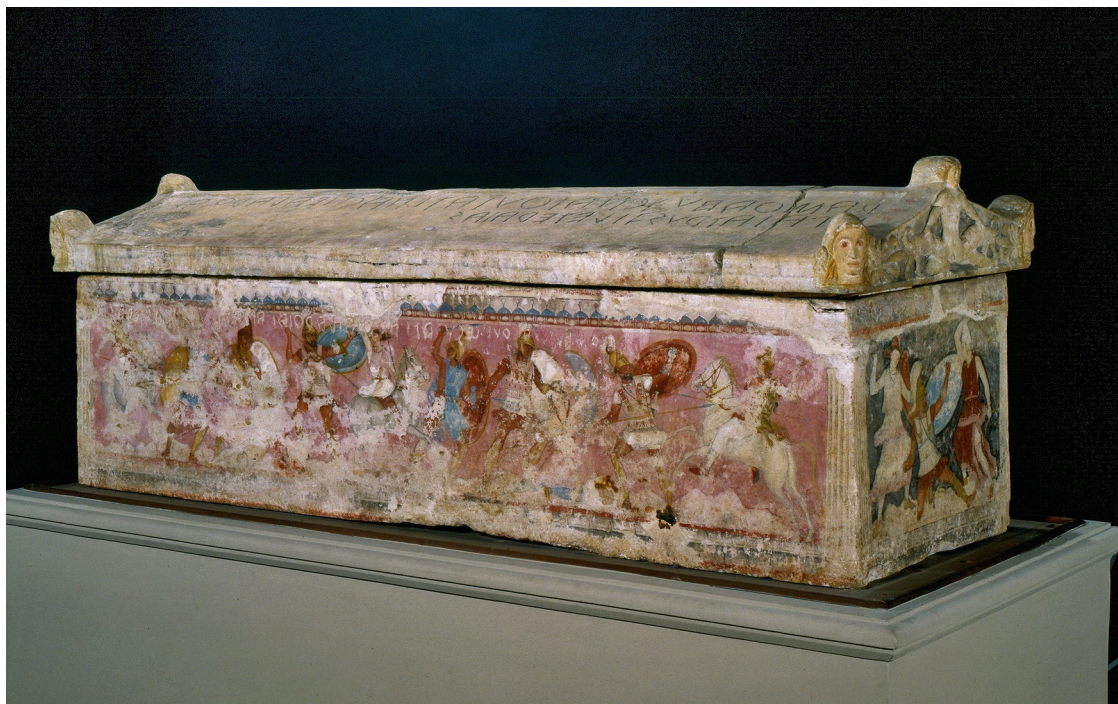
Sarcofago delle Amazzoni (metà IVsec. a C.)

Al Museo Archeologico , saranno visitabili le sezioni etrusca, egizia, e delle collezioni (con arte greca e romana), il Monetiere ed il Giardino monumentale (quest'ultimo con visite accompagnate).