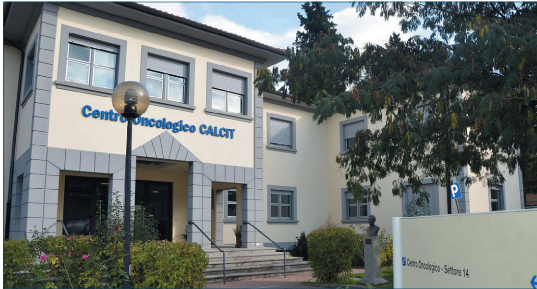
Il Centro oncologico Calcit

L'area interessata dalla ristrutturazione (costo previsto 850mila euro), è