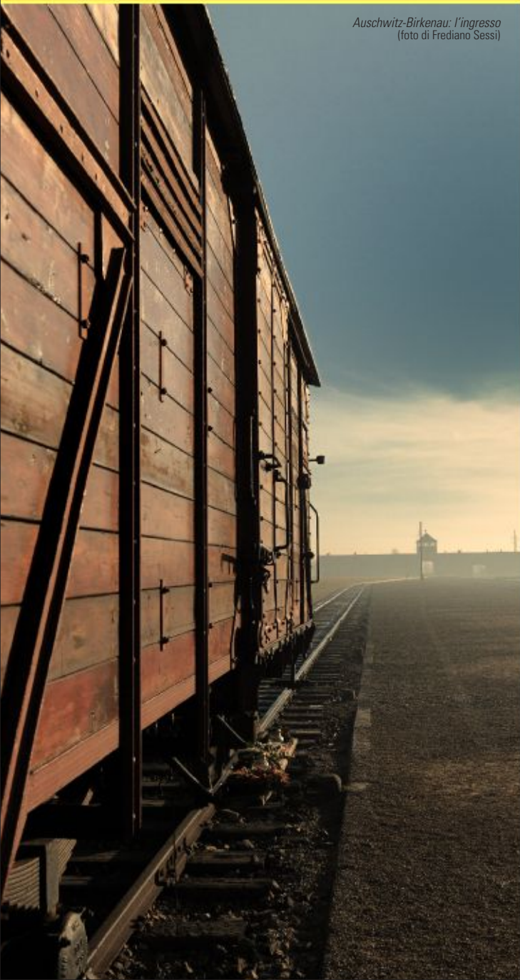
Auschwitz-Birkenau: l'ingresso